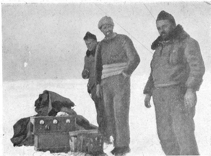
La cassetta di Biagi sul pack .